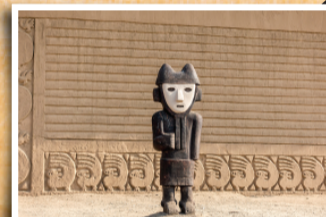
▲ 찰찬 (Chan Chan): AD900-AD1470 태평양 바다를 따라 번창했던 페루 왕국의 수도였음

● 바라카스 국립공원 (Paracas National Park): BC800-BC100 빠자까스 문명이 살았던 곳으로 바람과 파도로 깎인 극적인 해안선으로 유명