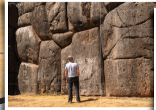
▲ 푸스코 (Cuzco) 잉카의 건축기술은 아직도 풀리지 않은 수수께끼로 남아 있음