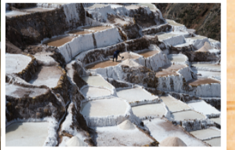
▲ 소금채굴 광산 (Salt Mines of Maras) 잉카 제국 때부터 내려온 소금광산