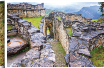
▲ 쿠엘라프 (Fortaleza De Kuelap): AD200-AD1570 일명 구름의 왕궁으로 불렸던 찰리팍아 왕국의 성 제 2의 마추픽추 라고도 불리며 케이블카로 이동함