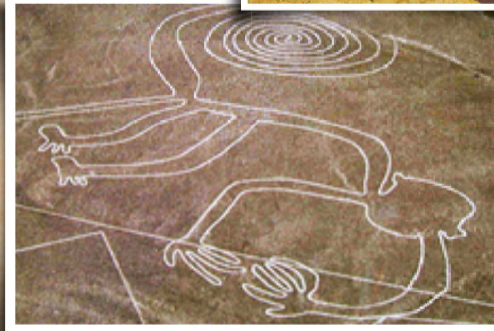
▲ 나스카 라인 (Nazca Lines): BC100-AD800 세계 7대 불가사의 중 하나로 나스카문명에 의해 그려 졌다함. 경비행기를 타고 봄