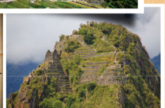
▲ 와야나 픽추 (Huayna Picchu) 잉카 사람들이 걸었던 돌길과 계단을 따라 올라 내려다 보는 마추픽추의 전경은 최고!