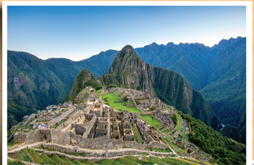
▲ 마추픽추 (Machu Picchu): AD1450 세계 7대 불가사의 중 하나로 잉카제국의 도시. 잃어버린 공중 도시라 불림