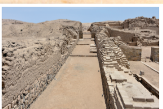
▲ 빠자까막 (Pachacamac): 200-1500AD 빠루의 도시 리마 근처에서 1300년 동안 흥했지만 잉카왕국으로 흡수됨