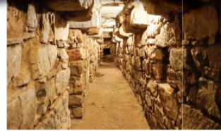
▲ 찰빈 데 우완따르 (Chavin De Huantar): BC1500-BC300 안데스 산맥 고산지대를 중심으로 주로 종교 의식을 위해 모여졌던 문화 엮었다고 함