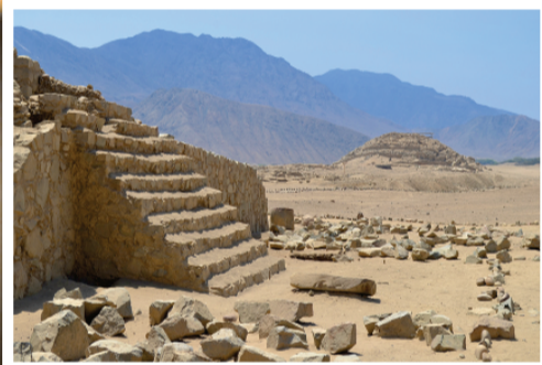
▲ 가랄 스페 (Caral Supe): BC3000-BC1500 626 헥타르 크기로 잘 보존되어 있는 피라미드 형식의 도시. 오늘 현재 발견된 도시 중 세계에서 가장 오래된 도시