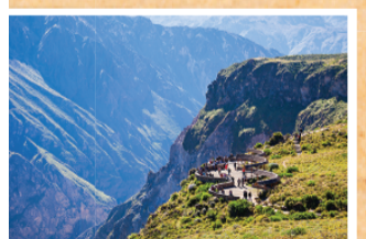
▲ 콜카 칸옌 (Colca Caynon) 세계에서 가장 깊은 협곡 NO.2