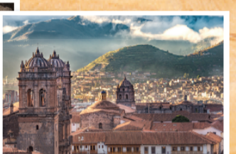
▲ 푸스코 (Cuzco): AD1438-현재 잉카 제국의 수도였고 스페인은 잉카가 쌓은 돌벽을 기초로 그들의 건물들과 교회를 세웠음 잘 보존되어 있는 아름다운 도시