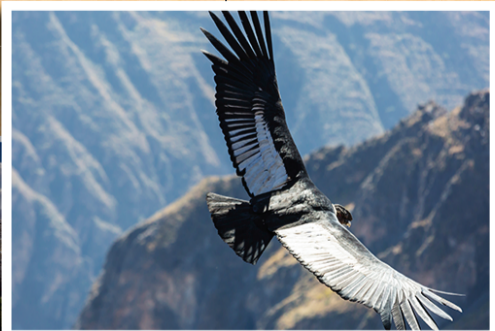
▲ 콜카 칸옌 (Colca Caynon) 칸옌 사이로 나르는 안데스 콘도르 새를 볼수 있음