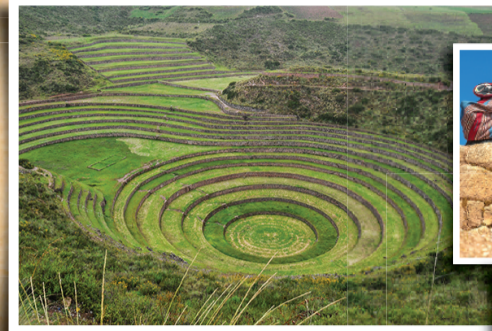
▲ 새크렛 벨리 (Sacred Valley): BC800-현재 우루밤바 강 가까이 있어 농업에 대한 연구와 실험을 했던 중요한 농업 도시. 잉카 문명과 그 전의 다른 문명들이 남긴 수많은 유적지들이 있고 후세들이 전통을 이어 아직도 살고 있음