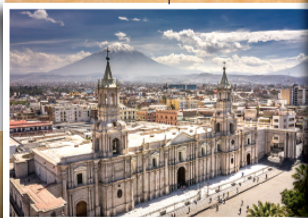
▲ 아레끼빠 (Arequipa): AD1540-현재 하얀 화산암, 실라 라는 돌로 지은 벽들이 많아 하얀도시라 불리는 아름다운 도시