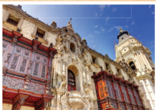
▲ 리마 역사지구 (Lima): AD1535-현재 발코니의 도시 리마, 스페인은 이 도시를 세우고 남미 식민지를 다스리기 위한 총독부 또한 이 도시에 세웠음. 부유층들만 살았던 도시로 남미의 첫대학교가 세워진 곳이기도 함